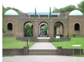
Museumspark Orientalis, Hauptgebäude