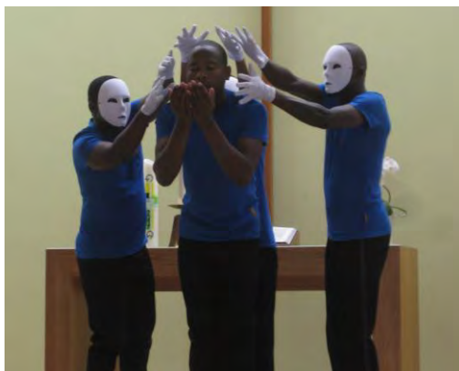
Clowns aus Mpumalanga