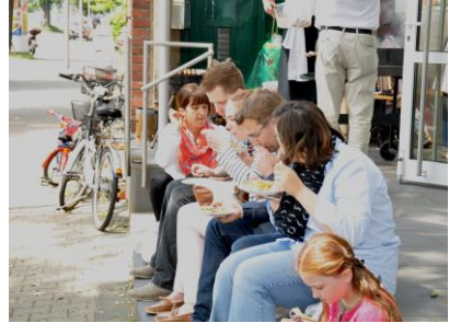
Auf den Stufen

Das Paul-Gerhardt-Haus an der Heerdtter Landstraße 30 ist eine gute Adresse. Menschen kehren dort gerne ein, um mit anderen gemeinsam einen Gottesdienst zu feiern oder sich einfach nur mit anderen zu treffen z.B. beim Kirchen-Café. Offene Türen gibt es auch am 18. Juni für Groß und Klein. Und ich bin mir sicher: Die Stufen vor dem Eingang vor unserer Kirche werden wieder besetzt sein... jjk