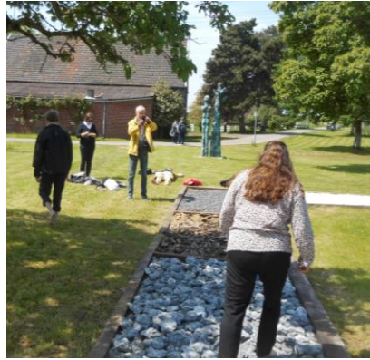
Park der Sinne, Kaarst